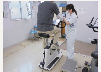
自転車エルゴメーター