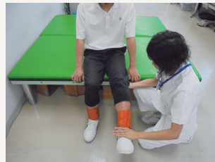
脚の筋力トレーニング