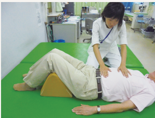
呼吸トレーニング 腹式呼吸の練習